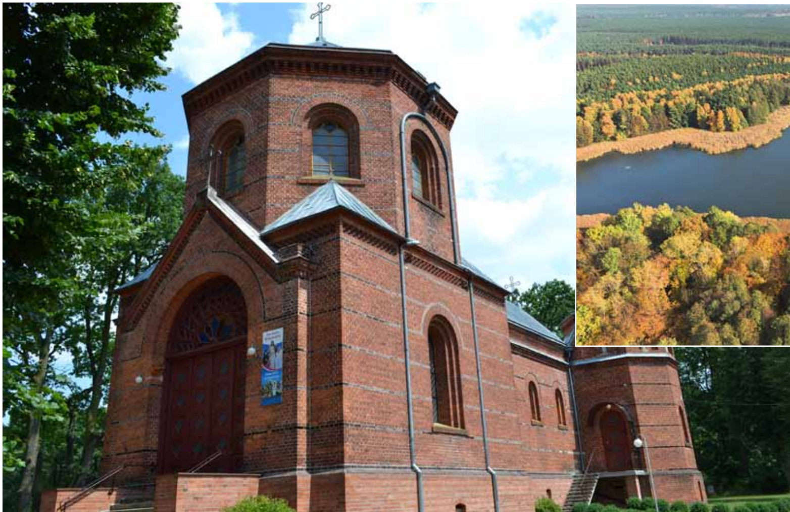
Kaplica Radziwiłłów (MB Ostrobramskiej)