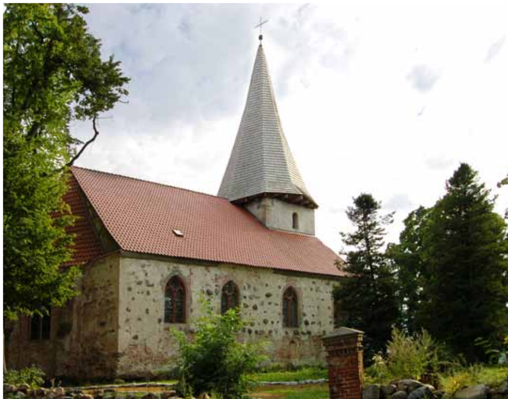
Kościół Parafialny pw. Zwiastowania Najświętszej Maryi Panny z XIII w.

Jest dominantą przestrzenną miejscowości oraz atrakcją turystyczną dla gości i turystów odwiedzających Łącko. Kościół usytuowany jest w centrum wsi. W 1500 r. przebudowano go na trzynawowy. Wpisany jest do rejestru zabytków wraz z otoczeniem (brama i cmentarz przykościelny) oraz wystrojem wnętrza: przetrwała chrzcielnica kamienna z XVII w., renesansowy ołtarz główny z XVII w., barokowy krucyfiks z XVIII w. z rzeźbą, późnogotycka rzeźba św. Anny Samotrzec z ok. 1500 r., ambona z XIX w., malowidło na stropie z XIX w., rzeźba Mojżesza, św. Marka i Chrystusa z XVIII w., dzwon z XVI w. i dwa lichtarze cynowe. W renesansowym ołta-