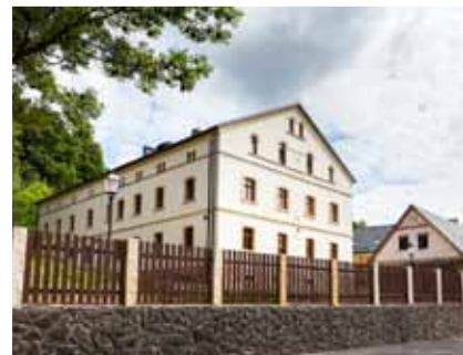
Sudecka Zagroda Edukacyjna

W Dobkowie przy pomocy gry terenowej poznasz historię sudeckiej wsi i historię powstawania planety. Dobków przed wojną był katolicką enklawą z kościołem, który zbierał wiernych z promienia niemal 25 km. Zachowała się dzięki temu duża liczba zabytków małej architektury sakralnej (w odróżnieniu od wsi protestanckich). We wsi z racji na położenie (25 km od Jeleniej Góry, Złotoryi i Jawora) nie powstały nowe, szpetne domy współczesne. Zachowała się niemal w stanie doskonałym sudecka architektura wiejska z ładem przestrzennym i historycznym centrum wsi. Dobków położony jest w sercu Krainy Wygasłych Wulkanów. W centrum wsi powstało nowoczesne interaktywne Centrum Nauki, które opowiada historię „ziemi, tej ziemi”, a z okolicznych wzgórz można zobaczyć jedyne w Polsce panoramę na pozostałości po 3 okresach wulkanizmu (sprzed 500 milionów, 250 milionów i 15 milionów lat) oraz inne ciekawe ślady historii ziemi: skały osadowe, wapienie z Wojcieszowa, czy osady polodowcowe z granitami przywleczonymi ze Skandynawii.