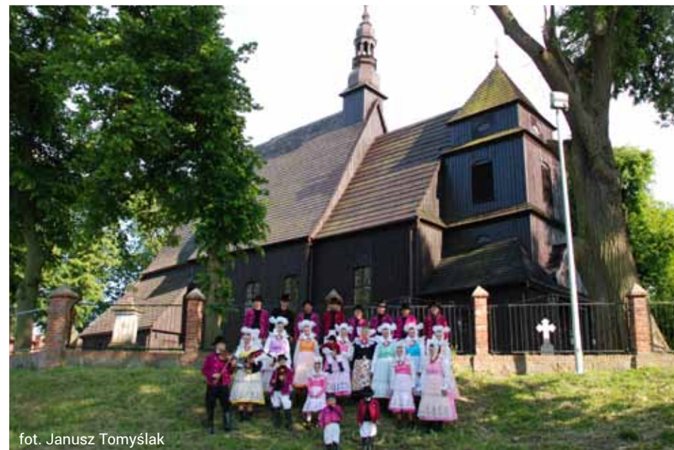
fol. Janusz Tomyślak