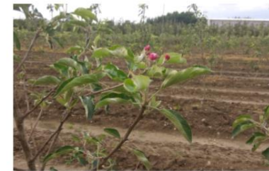
Spring frosts are particularly dangerous when the trees are in flower.