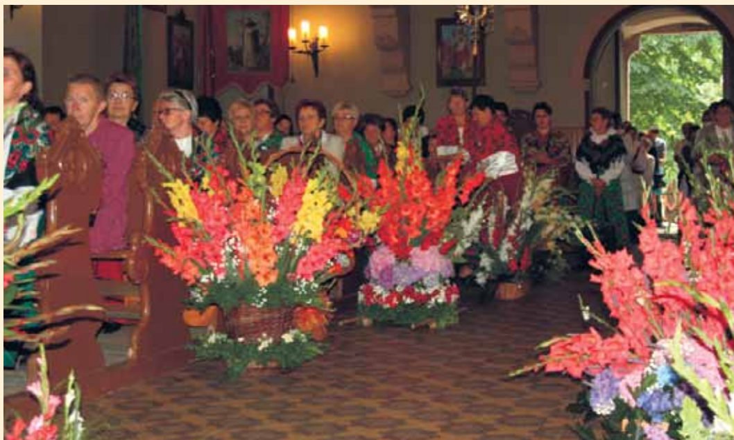
Kompozycje kwiatowe prezentowane podczas XIV Festiwalu Kwiatów

Celem festiwalu jest popularyzacja kwiatów jako ważnego elementu estetycznego wsi podkarpackiej, pobudzanie zainteresowania uprawą kwiatów oraz upowszechnianie sztuki układania kompozycji kwiatowych.