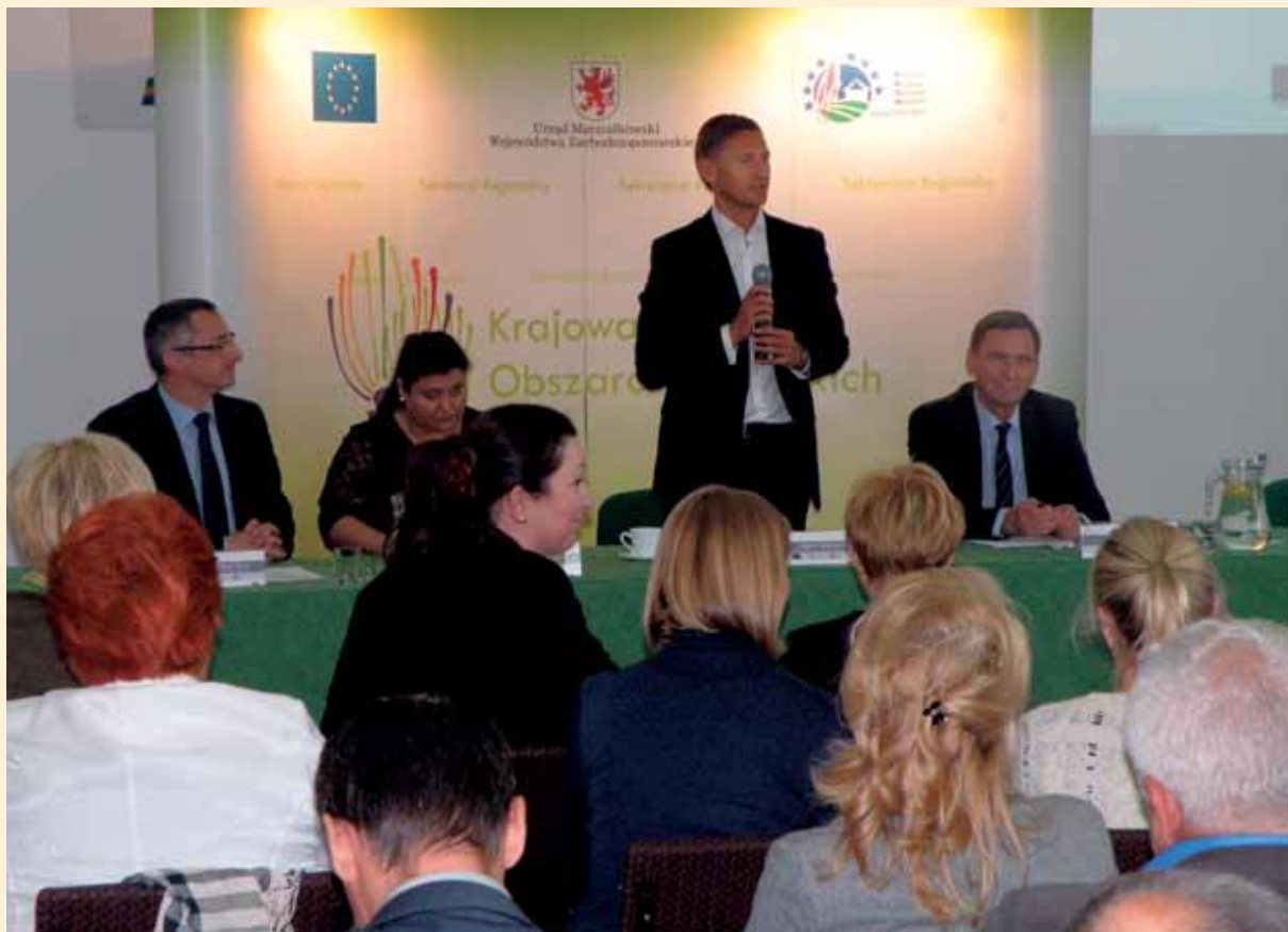
Spotkanie LGD w Barzkowicach

Na zakończenie uczestnicy spotkania wzięli udział w dyskusji na temat problemów, które mogą pojawić się w związku z realizacją podejścia Leader w nowym okresie programowania na lata 2014–2020, a także wskazali na ich możliwe rozwiązania. Przedsięwzięcie okazało się doskonałą okazją do porównania pomysłów i opinii wszystkich przedstawicieli LGD Województwa Zachodniopomorskiego na temat słabych i mocnych stron wdrażania podejścia Leader w minionych latach, a także wyrażenia swoich potrzeb co do przyszłych koncepcji współpracy z Wydziałem Programów Rozwoju Obszarów Wiejskich Urzędu Marszałkowskiego Województwa Zachodniopomorskiego.