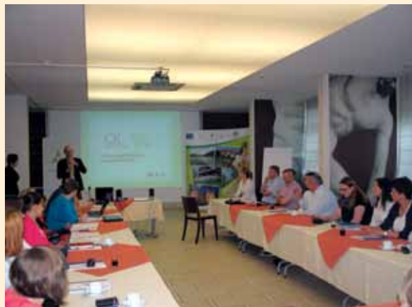
Spotkanie LGD z województwa śląskiego

W trakcie spotkania omawiano m.in. możliwości zastosowania w województwie śląskim in-