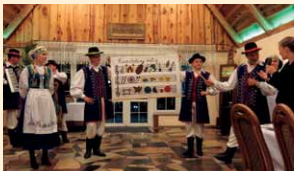
Kaszubski zespół regionalny Bazuki