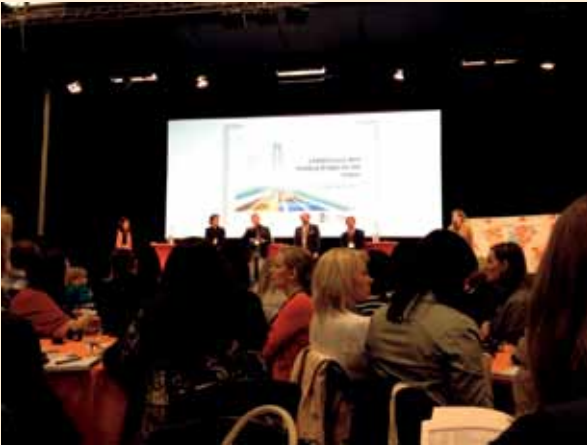
Sesja plenarna – rozpoczęcie obrad

kierunku rozwijać Lokalne Strategie Rozwoju i jak poszerzać grono osób zaangażowanych w rozwój lokalnych grup działania i realizację LSR. Najszerszą tematycznie grupę problemów skupił strumień trzeci. Dlatego znaczna grupa uczestników spotkania, wierząc w wagę swojej opinii, poszukiwała odpowiedzi na pytanie, jak uprościć i bardziej efektywnie wdrożyć podejście Leader w przyszłym okresie programowania.