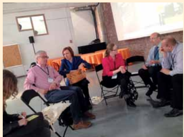
Grupa ds. małych projektów

W Radzie Programowej w Partnerstwie Kaczawskim reprezentuję trzeci sektor i szczególnie bliski jest mi problem małych projektów i problemów, z jakimi borykają się małe organizacje pozarządowe, tak mocno przez nas przekonywane do włączenia się w Program. Są to organizacje, które razem z nami pisały Lokalną Strategię Rozwoju. Tymczasem okazało się, że procedury administracyjne poprzez zasady wydatkowania pieniędzy, skutecznie utrudniły możliwości ich wykorzystania. Dlatego znalazłam miejsce w grupie poszukującej odpowiedzi na pytanie: jak uprościć małe projekty?