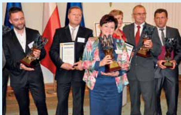
Laureaci XIII edycji konkursu Sposób na Sukces