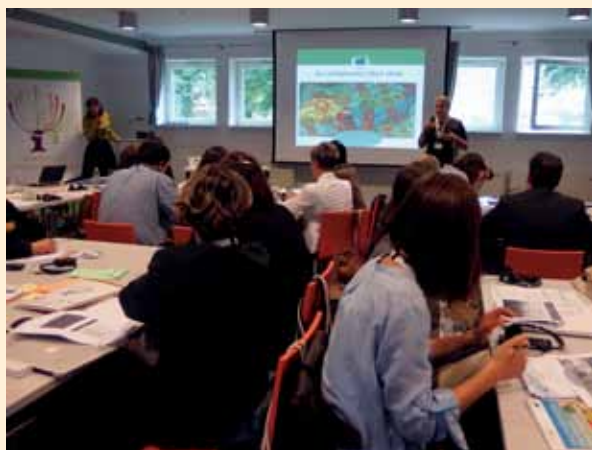
Spotkanie narodowych sieci obszarów wiejskich w Gdańsku – prezentuje Antonella Zona, Dyrekcja Generalna ds. Rolnictwa i Rozwoju Obszarów Wiejskich KE

Krajowa Sieć Obszarów Wiejskich w Polsce gościła, w dniach 11-13 września 2013 r., w Gdańsku przedstawicieli Komisji Europejskiej z Dyrekcji Generalnej ds. Rolnictwa i Rozwoju Obszarów Wiejskich, punktu kontaktowego Europejskiej Sieci na rzecz Rozwoju Obszarów Wiejskich, narodowych sieci obszarów wiejskich i instytucji zarządzających programami rozwoju obszarów wiejskich z 22 krajów członkowskich Unii Europejskiej. Wśród ponad 70 uczestników po raz pierwszy znaleźli się przedstawiciele sekretariatów regionalnych KSOW. Program spotkania obejmował planowanie struktur sieci, zasobów i dalszych zadań w nowym okresie programowania na lata 2014-2020.