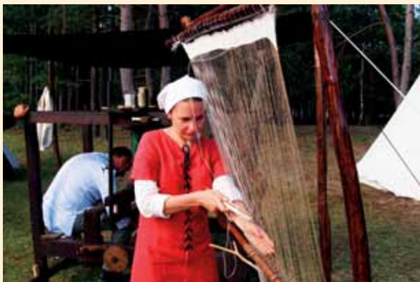
Festiwal Kultury Dawnej

W kolejny czerwcowy weekend można było udać się do miejscowości Czarze w gminie Dąbrowa Chełmińska koło Bydgoszczy, gdzie blisko 80 wystawców prezentowało swoje wyroby kulinarne i rękodzielnicze podczas III Jarmarku w Zakolu Dolnej Wisły . Była to świetna okazja do zakupu coraz bardziej cenionych produktów tradycyjnych. Wśród licznych atrakcji znalazły się programy artystyczne przygotowane przez gminy Zakola Dolnej Wisły, pokazy garncarskie oraz prezentacje pieczenia podpłomyków. Ważną częścią imprezy był „Festiwal Kultury Dawnej” , dzięki któremu uczestnicy zapoznali się z tradycjami dawnego rzemiosła i dziedzictwa kulinarnego. W jednej chwili, dzięki pokazom grupy rekonstrukcyjnej „Kuźnia Kultury”