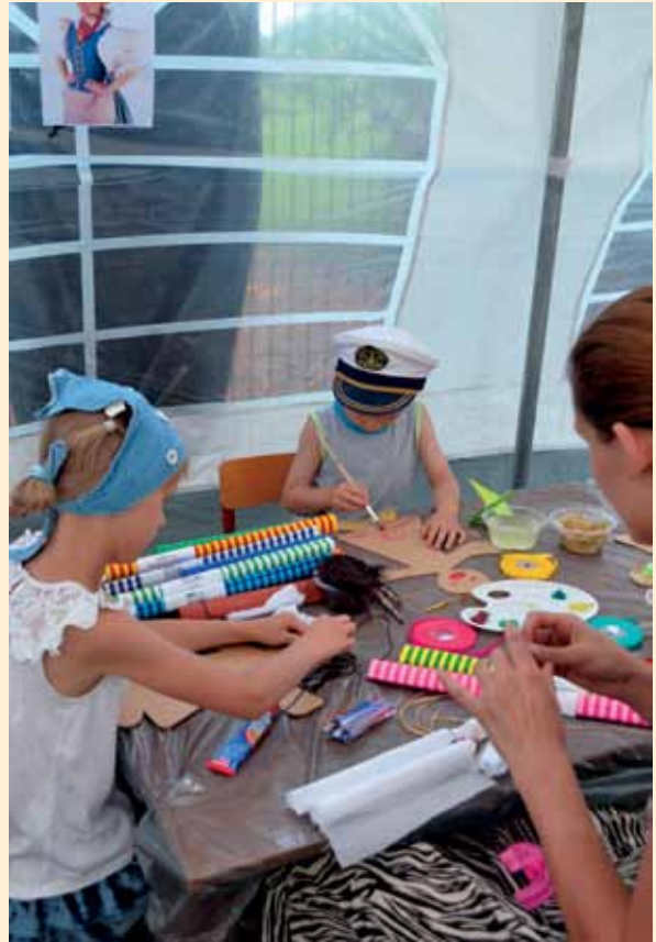
Impreza plenerowa w Lulkowie