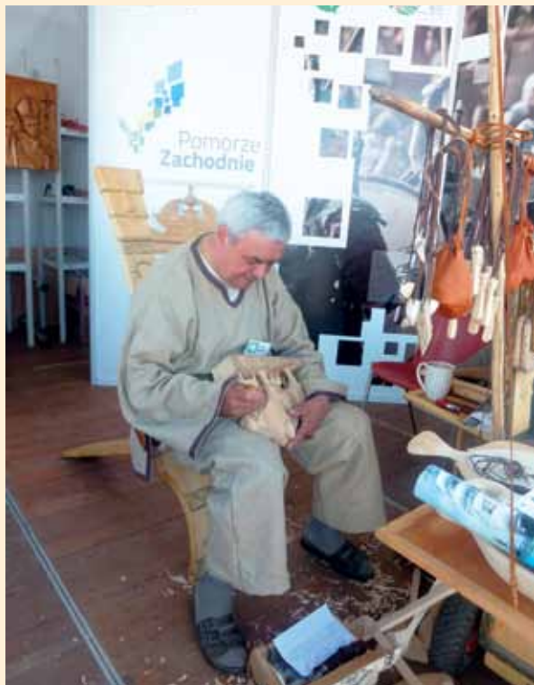
The Tall Ships Races 2013

Wydarzenie to było także doskonałą okazją do promocji produktów turystycznych, tradycyjnych i regionalnych z województwa zachodniopomorskiego. Do prezentowania naszego regionu zostali zaproszeni producenci i wytwórcy produktów regionalnych i tradycyjnych oraz twórcy ludowi z Pomorza Zachodniego. W sześciu namiotach wystawienniczych zwiedzający mieli możliwość skosztowania regionalnych wyrobów wytwarzanych od lat zgodnie z oryginalnymi recepturami, wśród których znalazły się produkty piekarnicze (chleby, bułki, ciasta, pierniki), przetwory ekologiczne (dżemy, konfitury z róży), wędliny, miody, ryby wędzone i przetwory rybne oraz wiele innych produktów regionalnych. Dodatkową atrakcją dla zwiedzających była możliwość wybicia okolicznościowej monety oraz wzięcia udziału w pokazach rzeźbienia z drewna ludowych przedmiotów.