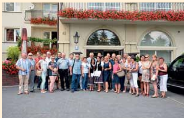
Podróż studyjna opolskich członków ESRDK do woj. świętokrzyskiego

Na trasie podróży była m.in. przetwórnia ryb w Oksie, sięgająca swoimi tradycjami XVI wieku, zakład wyrobów tradycyjnych „u Bogusia” w Łosieniu, produkujący mięso i wędliny z wieprzowiny; cukiernie „Dorotka”, w których ciasta są wytwarzane na bazie produktów ekologicznych i regionalnych oraz sklep „Tygiel Smaków”, oferujący wszelkiego rodzaju wyroby regionalne i ekologiczne.