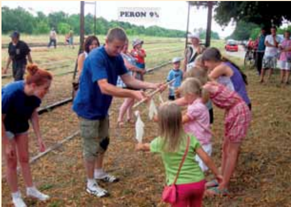
Festyn Kolejarski „Zapomniana Stacja”