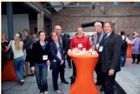
Reprezentacja polskich LGD

Dwudniowe spotkanie odbyło się w brukselskim centrum The Egg, powstałym, by na co dzień łączyć