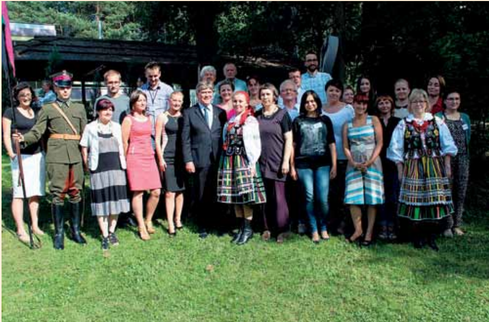
Szkolenie dla liderów wiejskich

i rozliczania środków z działalności organizacji oraz promocji i animacji. Uczestnicy szkolenia nie tylko nabyli nowe umiejętności, ale też poznali siebie nawzajem i chętnie dzielili się doświadczeniami