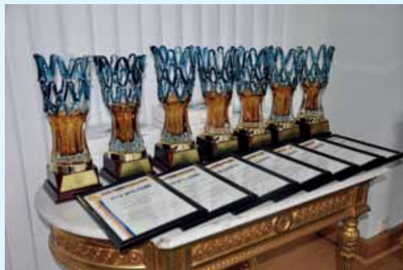
Nagrody i wyróżnienia dla laureatów XIII edycji

Laureaci i wyróżnieni w trzynastu edycjach konkursu to ludzie sukcesu: przedsiębiorcy, organizacje oraz instytucje działające na obszarach wiejskich i w miastach liczących nie więcej niż 20 tys. mieszkańców. Firmy te rozwijają się, tworząc kolejne miejsca pracy i umacniają swoją pozycję na rynku. To