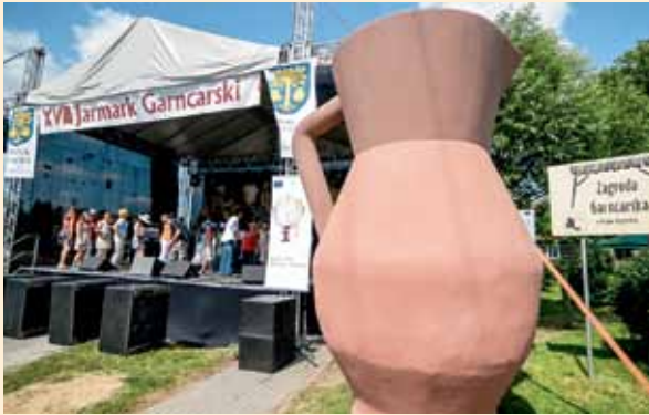
XVIII Jarmark Garncarski