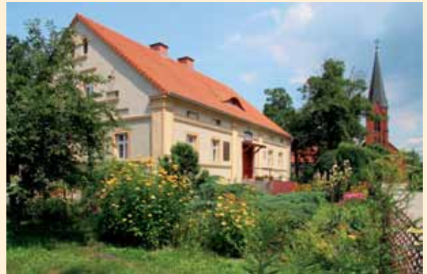
Karłowice – Najpiękniejsza Wieś 2013

Konkurs „Piękna wieś opolska” odbywał się po raz szesnasty. Jego uroczyste podsumowanie i wręczenie nagród zaplanowane jest na 21 września br. w Karłowicach – w miejscowości, która zwyciężyła tegoroczną rywalizację.