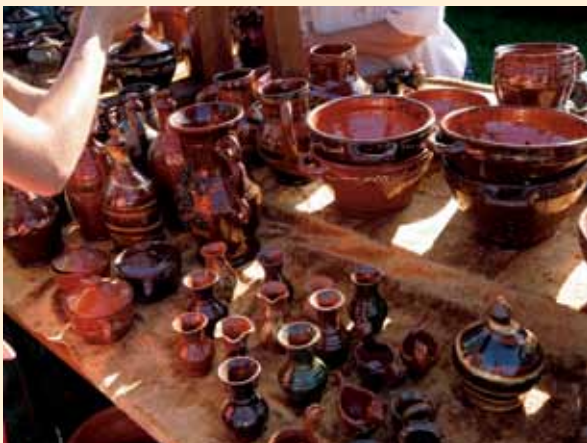
Wyroby garncarskie prezentowane podczas XVIII Jarmarku Garncarskiego

Wydarzenie miało na celu nie tylko podtrzymywanie tradycji, ale także wspieranie rozwoju lokalnej przedsiębiorczości.