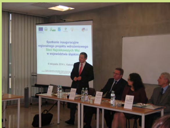
Spotkanie informacyjne w Katowicach

Śląski Związek Gmin i Powiatów wraz z wojewódzkim Sekretariatem Regionalnym Krajowej Sieci Obszarów Wiejskich zorganizował w terminie od 6 listopada do 5 grudnia 2014 r. cykl spotkań związanych z realizacją wstępnego projektu wdrożeniowego dotyczącego utworzenia Sieci