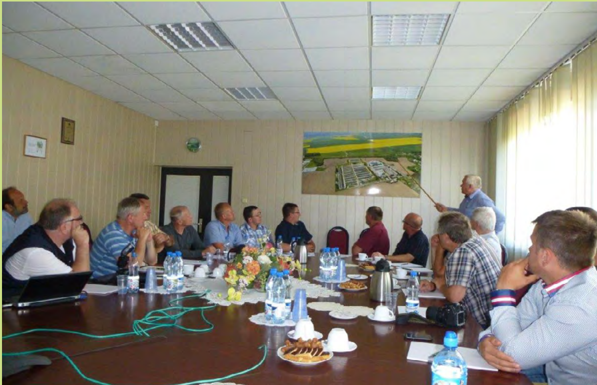
Wyjazd studyjny do województwa lubuskiego

tradycyjnego krupnioka śląskiego, który ubiega się o rejestrację w systemie CHOG). Ponadto uczestników forum zapoznano z technologiami stosowanymi przy wytwarzaniu sera smażonego – produktu wpisanego na Listę Produktów Tradycyjnych oraz możliwościami sprzedaży tych wyrobów w dużych obiektach oraz w sieciach handlowych.