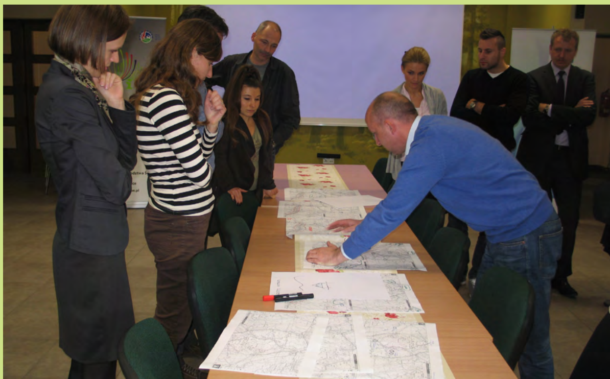
Wizja terenowa w Istebnej

Uczestnikami spotkań byli przedstawiciele gmin wytypowanych do realizacji projektu, jak również przedstawiciele sołectw uczestniczących w projekcie.