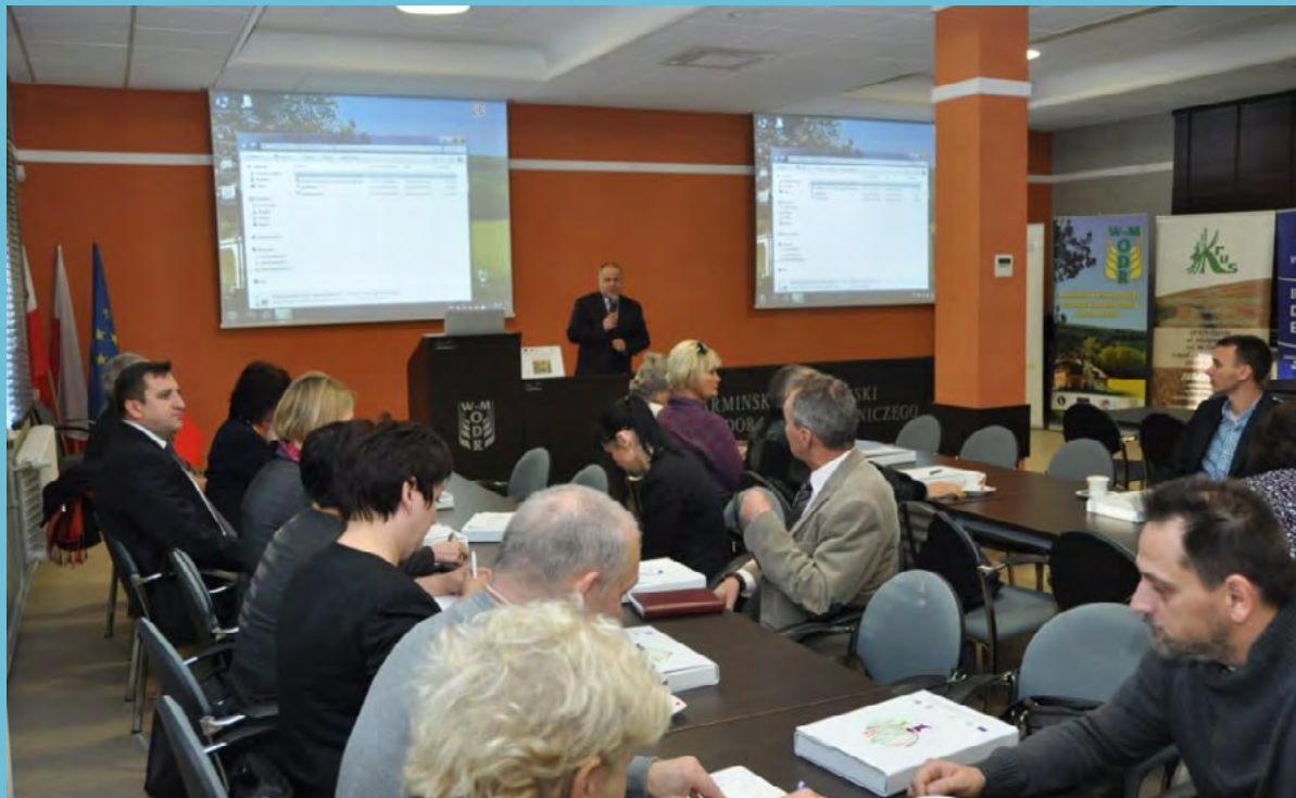
Konferencja o jakości produktów rolnych i ogrodniczych w warmińsko-mazurskim, Źródło: Archiwum SR KSOW

marketingowych, sposobów promocji oraz sposobów ustalania cen;