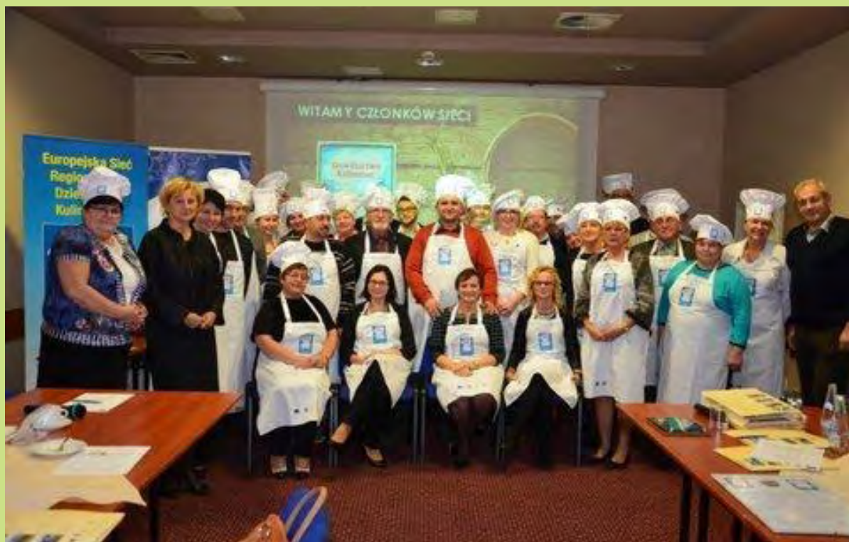
Forum członków Sieci Dziedzictwo Kulinarne Opolskie

Drugiego dnia uczestnicy konferencji wzięli udział w wyjeździe studyjnym do członków sieci Dziedzictwo Kulinarne Opolskie w celu zapoznania się z technologiami stosowanymi w zakładach i możliwościami sprzedaży produktów wysokiej jakości oraz warunkami uczestnictwa w systemach jakości żywności. Zaprezentowano dobre praktyki związane m.in. z wytwarzaniem certyfikowanego produktu – „Kołocza Śląskiego”, zarejestrowanego jako Chronione Oznaczenie Geograficzne (CHOG) oraz ze stosowanymi technologiami w zakładzie produkcji wyrobów wędliniarskich (m. in.