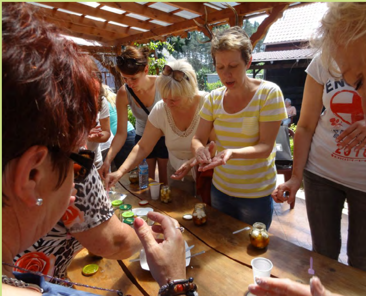
Warsztaty w zagrodach edukacyjnych