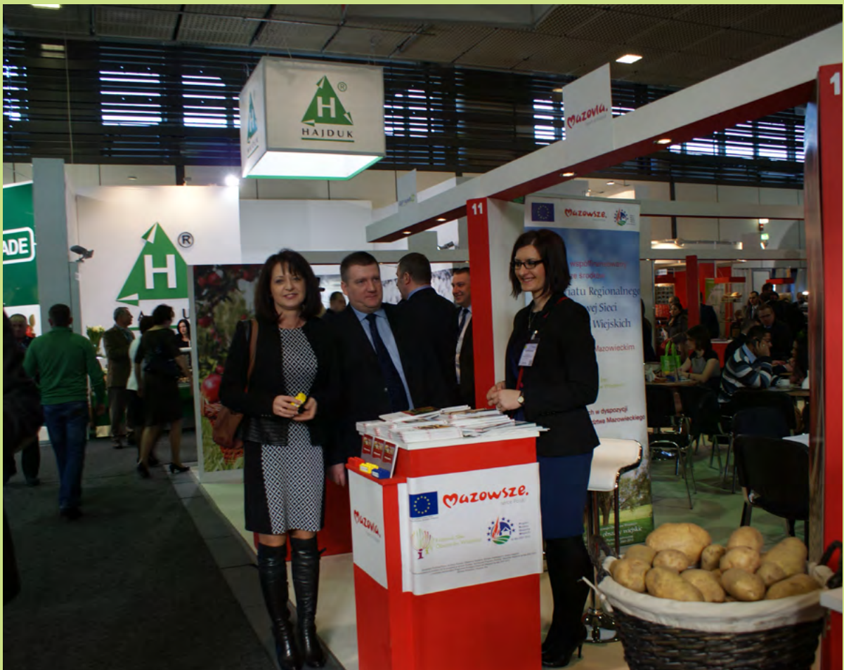
Targi Fruit Logistica

ternetowe. Uczestniczymy w imprezach targowych – w niektórych z nich regularnie bierzemy udział, współfinansując nasz wkład krajowy i regionalny. Były to następujące wydarzenia: Międzynarodowe Targi Owoców i Warzyw FRIUT LOGISTICA w Berlinie, Międzynarodowe Targi Turystyki Wiejskiej i Agroturystyki AGROTRAVEL w Kielcach oraz Międzynarodowe Targi Turystyki TT WARSAW w Warszawie. Staraliśmy się także promować mazowiecką przedsiębiorczość i obszary wiejskie na imprezach lokalnych: Targi Produktów Regionalnych REGIONALIA w Warszawie, Mazowieckich Targach Rolnych w Ostrołęce, Mazowieckich Targach Rolnych i Przedsiębiorczości w Sochaczewie czy Ogólnopolskich Targach Papryki w Przytyku. Wszystkie te wizyty pozwalały podpatrywać lepszych od siebie, przyglądać się dobrym praktykom i wykorzystywać je w codziennej działalności.