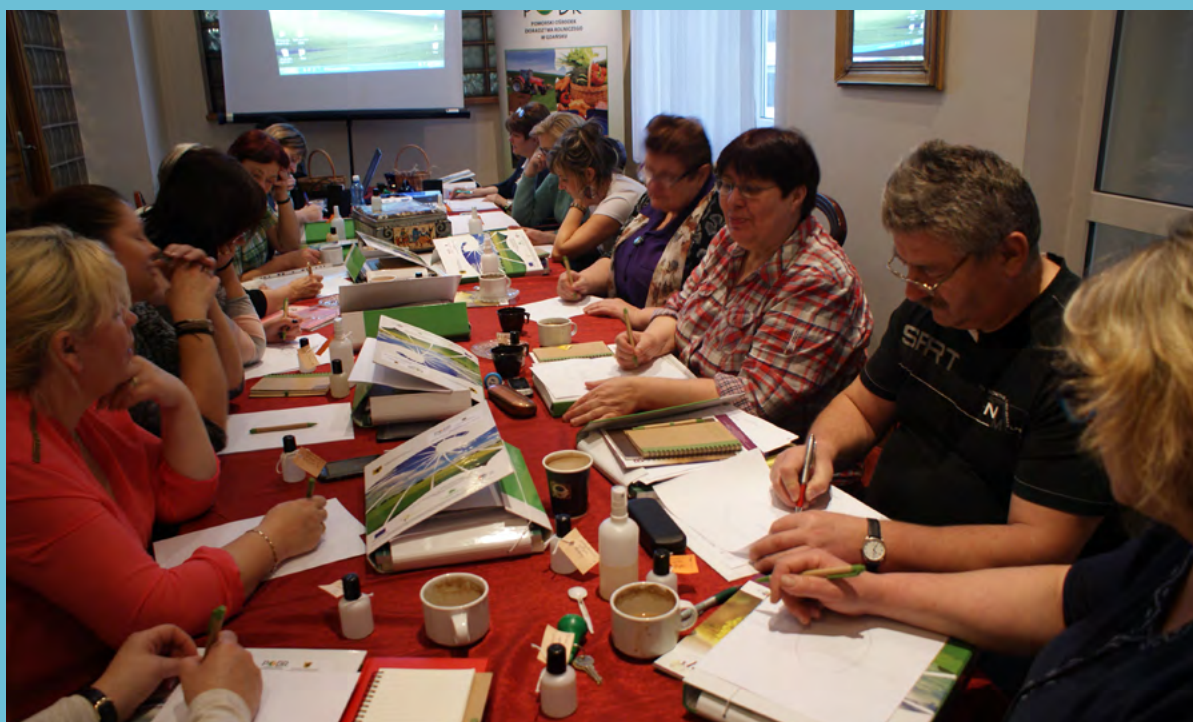
Nowe formy przedsiębiorczości na wsi – warsztaty w woj. pomorskim