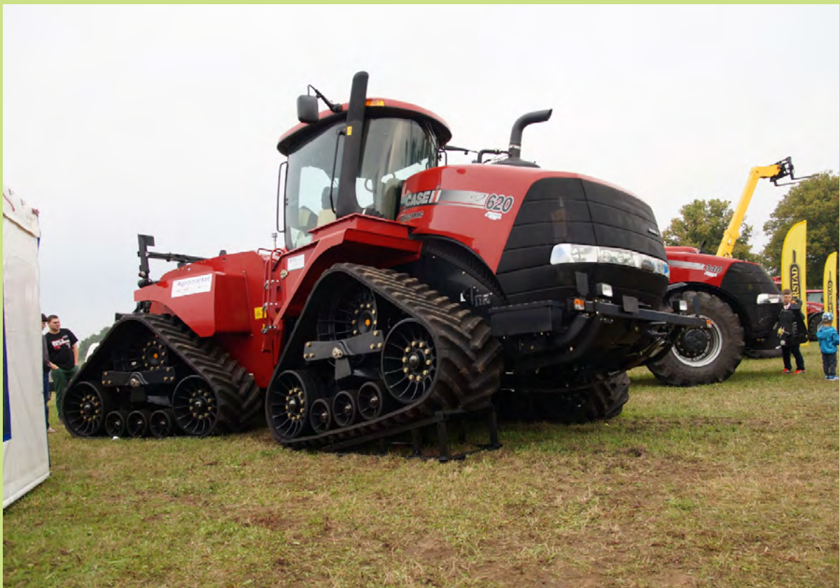
Najlepszy produkt na targach to nowoczesny ciągnik.

największym wydarzeniem plenerowym na Pomorzu Zachodnim skierowanym do rolników, właścicieli gospodarstw agroturystycznych,