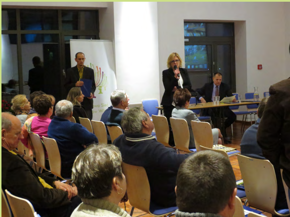
Szkolenie dla producentów rolnych

W okresie od marca do czerwca 2014 r. miał miejsce cykl szkoleń pn. „Dobre praktyki w gospodarstwach ekologicznych gwarancją