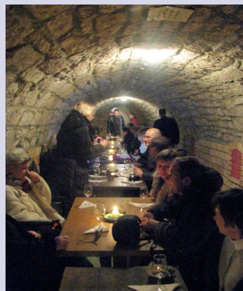
Degustacja win tokajskich

W wyjeździe studyjnym uczestniczyli przedstawiciele Lokalnych Grup Działania, Agencji Restrukturyzacji i Modernizacji Rolnictwa – Oddział Regionalny w Krakowie, przedstawiciele Samorządu Województwa Małopolskiego, w tym pracownicy zespołu ds. Leader i KSOW oraz specjaliści z CDR o /Kraków – łącznie 40 osób.