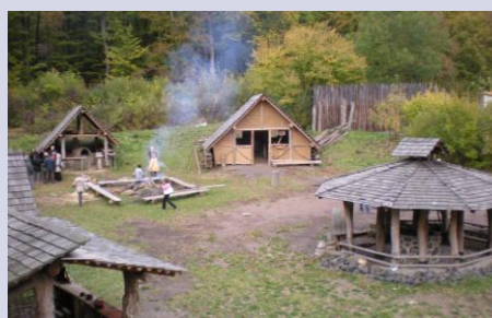
wioska celtycka w Sünna