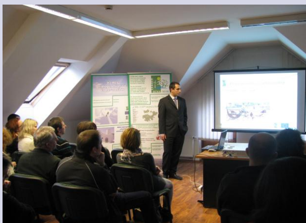
Program merytoryczny w LGD Bűkk-Mag

W dniach 28 listopada do 1 grudnia 2010 r. Centrum Doradztwa Rolniczego Oddział w Krakowie zorganizowało wyjazd studyjny na Węgry w okolice Egeru i Miszkolca w ramach działania „Wyjazdy w celu wymiany informacji, doświadczeń i know-how z zakresu rozwoju obszarów wiejskich”, zgodnie z Planem Działania KSOW na lata 2010-2011 w ramach schematu III „Stworzenie i utrzymanie Krajowej Sieci Obszarów Wiejskich” - Pomoc Techniczna Programu Rozwoju Obszarów Wiejskich na lata 2007 – 2013.