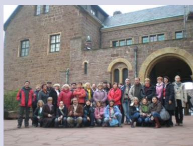
uczestnicy na dziedzińcu zamku Wartburg

Dużym zainteresowaniem uczestników cieszyła się również wybudowana w ramach programu Leader+ wioska celtycka w Sünna.