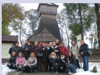
Uczestnicy przed Kościółem św. Michała Archaniola

W dniach 19 do 22 października uczestnicy odwiedzili obszar działania Lokalnej Grupy Działania Rozwój Spisza i Okolicy. Podczas pobytu na Spiszu uczestnicy wyjazdu mieli okazję poznać walory kulturowe, historyczne oraz przyrodnicze polskiego Spisza i okolic (m.in. zamek w Niedzicy, kościół pw. św. Michała Archaniola w Dębnie Podhalańskim, Dom Pamięci Ks. Prof. Józefa Tischnera w Łopusznej, szałas pasterskie oraz tartak w Jurgowie, Zagrodę Korkoszów na Czarnej Górze będącą filią Muzeum Tatrzańskiego, Rezerwat Przyrody Przełom Białki pod Krempachami, Szkołę Ginących Zawodów Folkloru i Sztuki Ludowej w Bukowinie Tatrzańskiej, Termy bukowińskie).