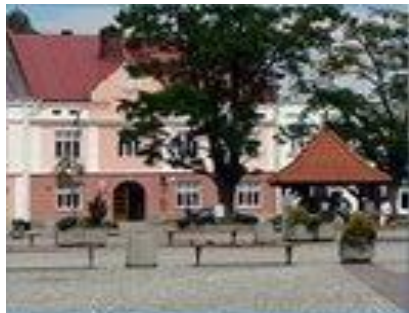
Odnowa i rozwój wsi

Ten z kolei cel zamierza się osiągać poprzez: wspieranie zatrudnienia, aktywizację obszarów wiejskich, poprawę gospodarki wiejskiej oraz promocję dywersyfikacji, a także tworzenie warunków do różnorodności społecznej, strukturalnej (poprawa kondycji małych gospodarstw oraz rozwój rynków lokalnych).