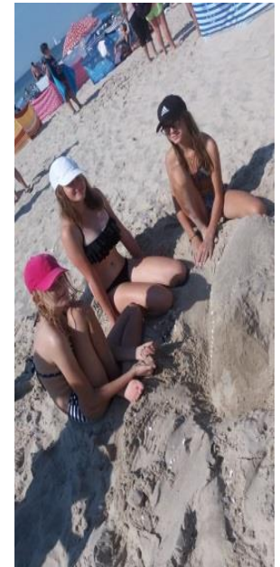
Obozy szkoleniowo – wypoczynkowe dla dzieci nad Morzem Bałtyckim