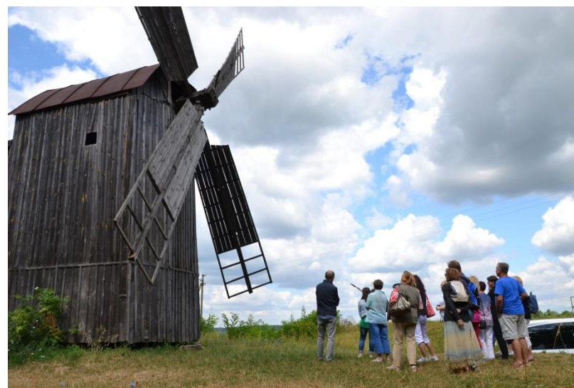
Wyjazdy studyjne do Partnera na Słowację i na Ukrainę