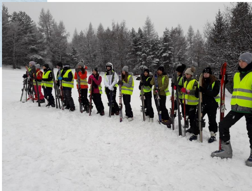
Wyjazd wypoczynkowy dla dzieci i młodzieży na Słowację