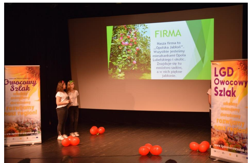
Konkursy wiedzy o przedsiębiorczości dla dzieci i młodzieży