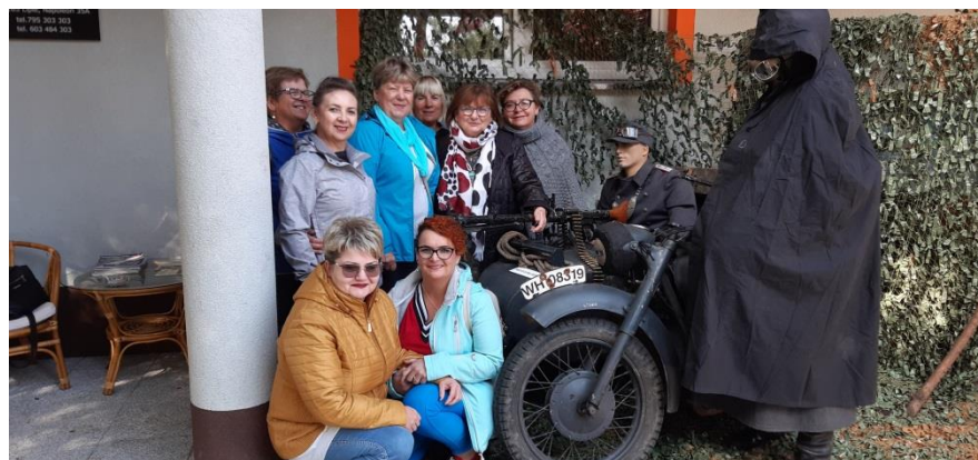
Wizyty studyjne u na tereny działania Partnerów w kraju