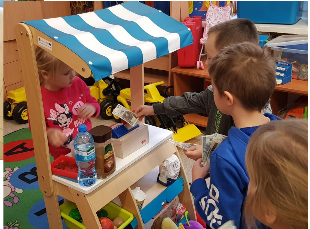
Zajęcia edukacyjne z zakresu ekonomii i przedsiębiorczości dla dzieci przedszkolnych - LGD „Kraina Rawki”