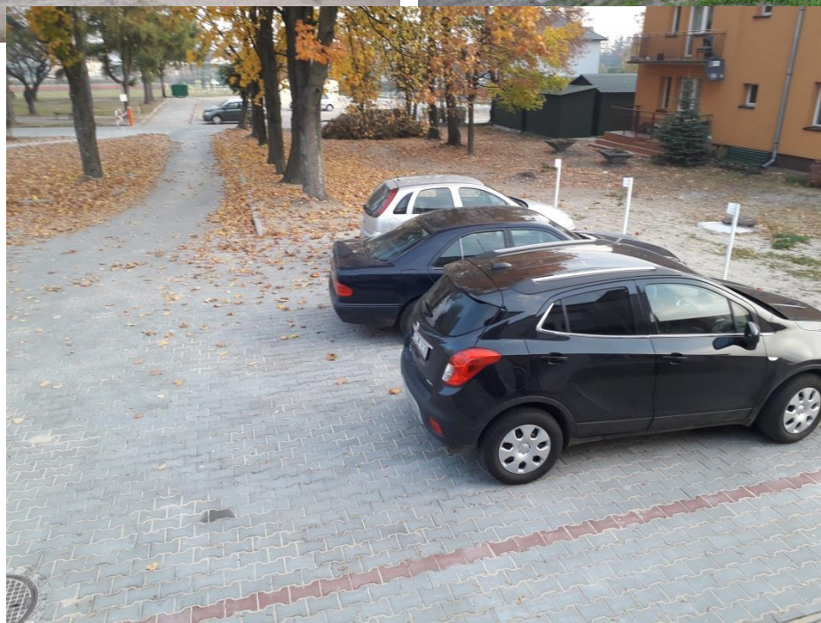
Budowa parkingu na potrzeby działalności Lokalnego Centrum Wsparcia Przedsiębiorczości we Włoszczowie