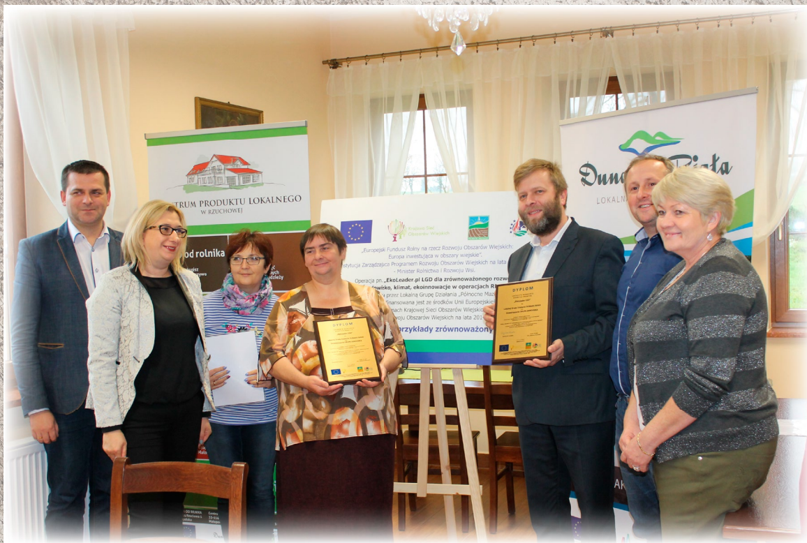
Uhonorowani laureaci Konkursu „Eko-Leader LGD” w Centrum Produktu Lokalnego w Rzuchowej