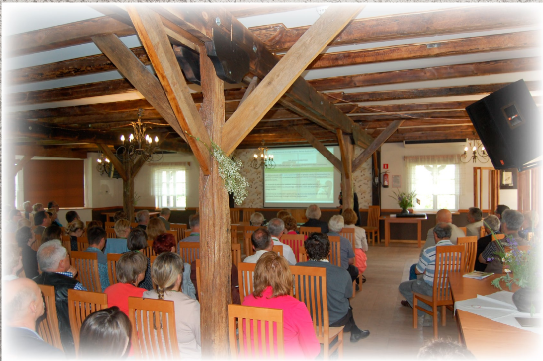
Uczestnicy zajęć edukacyjnych w Centrum Edukacji Przyrodniczej