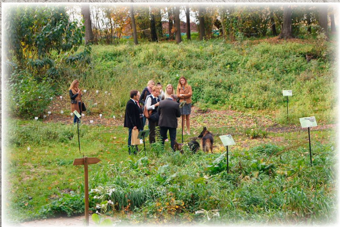
Wizyta studyjna w Ogrodzie Botanicznym „Ziołowy Zakątek”