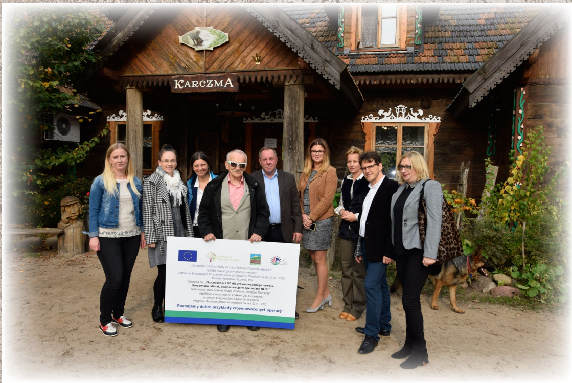
Uczestnicy wizyty studyjnej w „Ziołowym Zakątku”, październik 2017 r.