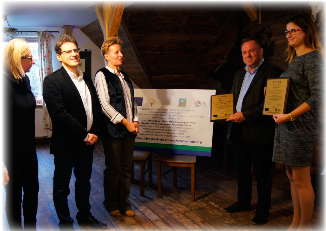
Uhonorowanie laureatów Konkursu w październiku 2017 r.

Stale wydłuża nam się sezon. Na początku trwał od połowy maja do połowy września. Teraz pierwsze wycieczki zaczynają się już w marcu, a odwiedziny i zajęcia trwają nawet do listopada. Myślę, że będziemy dalej się rozwijać.