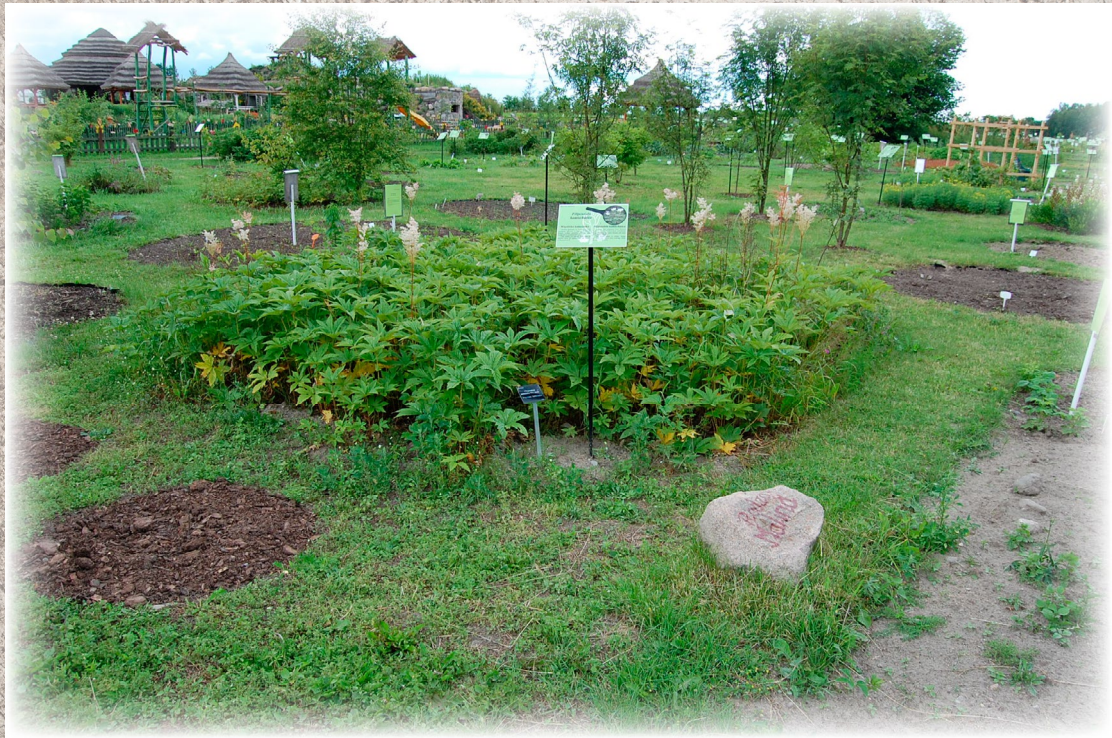
Tabliczki informacyjno-edukacyjne w Ogrodzie Botanicznym „Ziołowy Zakątek”