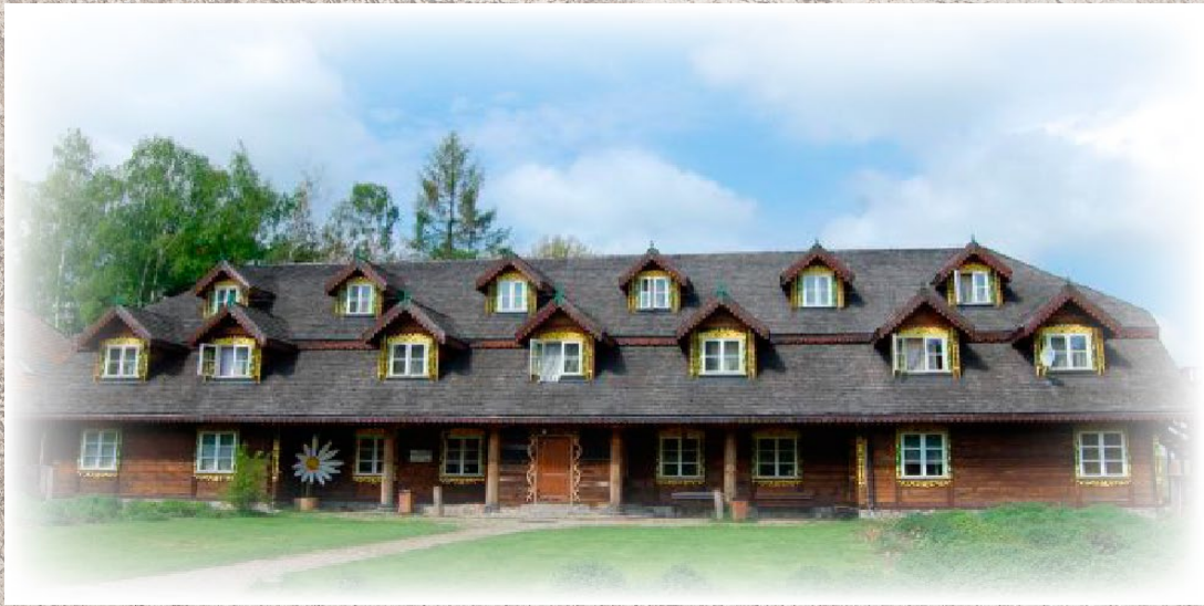
Budynek Centrum Edukacji Przyrodniczej „Ziołowy Zakątek”