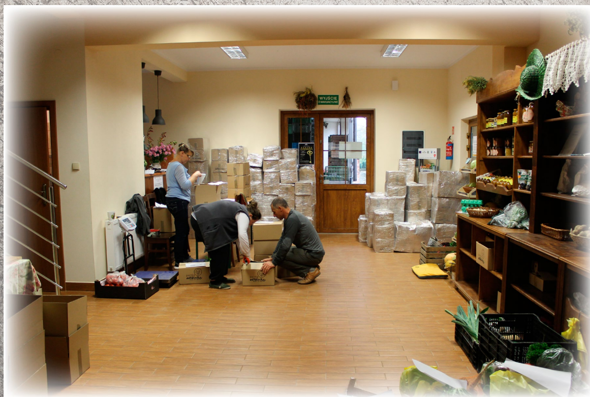
Paczki ODROLNIKA przygotowane do wysyłki w CPL w Rzuchowej