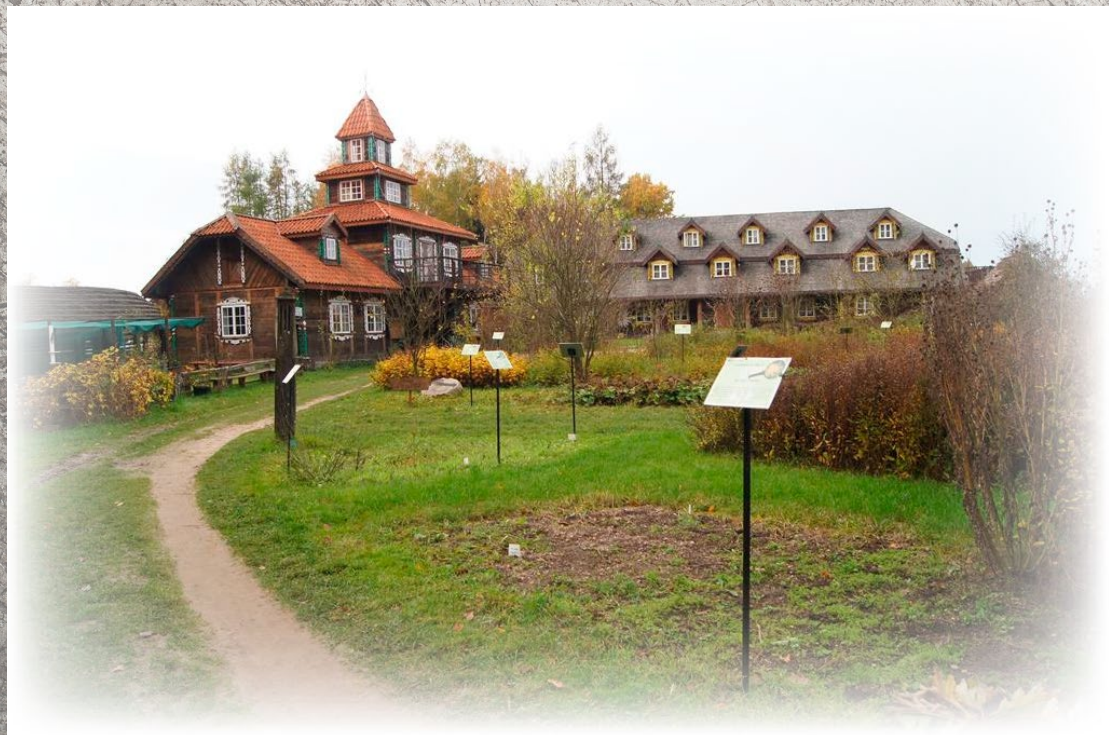
Tabliczki informacyjno-edukacyjne w Ogrodzie Botanicznym „Ziołowy Zakątek”